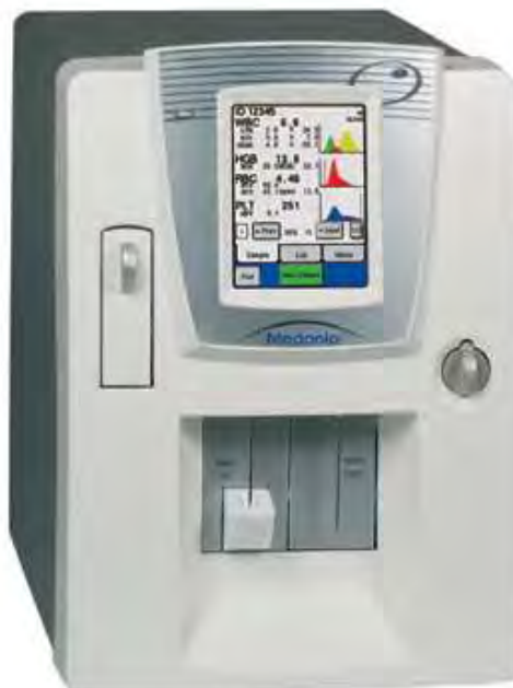
Рисунок 3 – Общий вид анализатора исполнение M16C Closed Tube , M16C Closed Tube ABR , M20C Closed Tube, M20C Closed Tube ABR