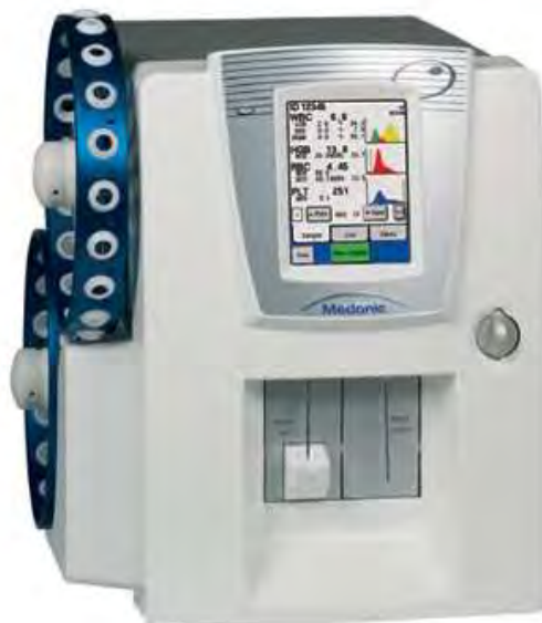
Рисунок 4 – Общий вид анализатора исполнение M16S Autoloader, M16S Autoloader ABR, модель M20S Autoloader, M20S Autoloader ABR