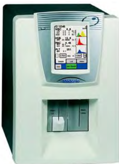
Рисунок 1 – Общий вид анализатора исполнение M10, M16, M20