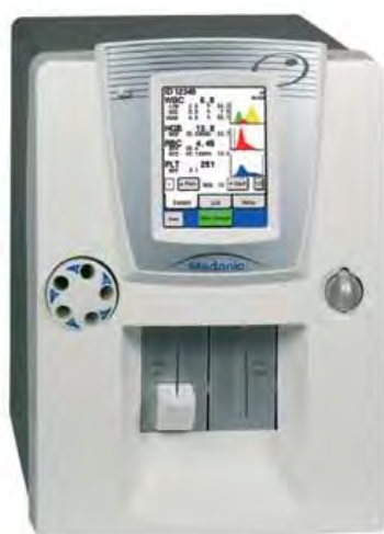
Рисунок 2 – Общий вид анализатора исполнение M16M GP, M20M GP