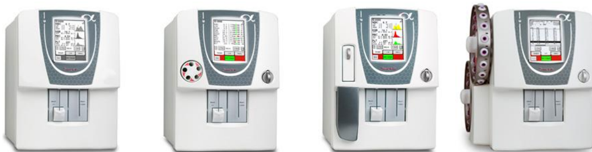
Рисунок 1. Внешний вид анализаторов гематологических Swelab Alfa моделей Basic, Standard, Auto Sampler, Cap Piercer

Модели анализаторов отличаются дизайном и производительностью.